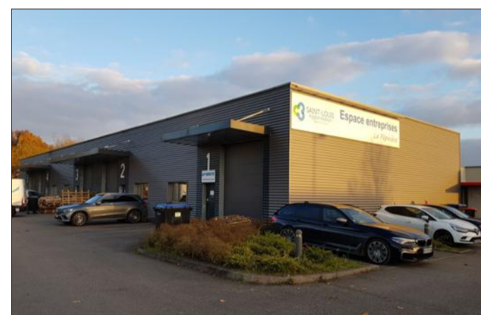
La pépinière d'entreprises de Saint-Louis agglomération affiche complet : les cinq bureaux et les cinq ateliers sont tous occupés actuellement.

Y ALLER Pépinière d'entreprises de Saint-Louis agglomération, 4 allée de la Hardt à Schlierbach. Visite libre sans rendez-vous le vendredi 19 novembre, de 9 h à 17 h. Pas de pass sanitaire demandé, port du masque obligatoire. Renseignements au 03.89.39.00.69 ou sur www.pepiniere-entreprises-3f.fr